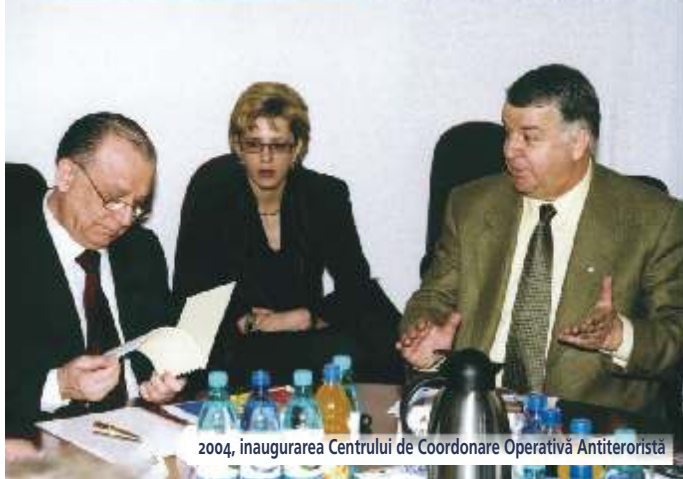
2004, inaugurarea Centrului de Coordonare Operativă Antiteroristă