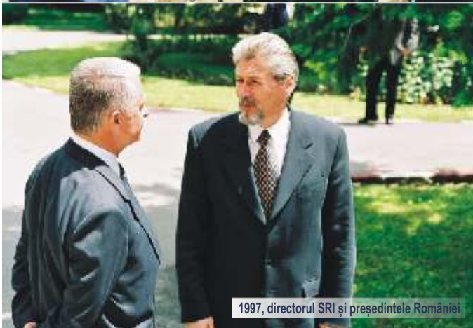
1997, directorul SRI și președintele României