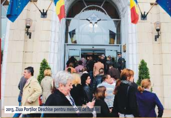
2013, Ziua Porților Deschise pentru membrii de familie