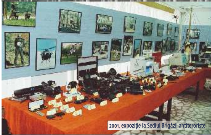
2001, expoziție la Sediul Brigăzii antiteroriste