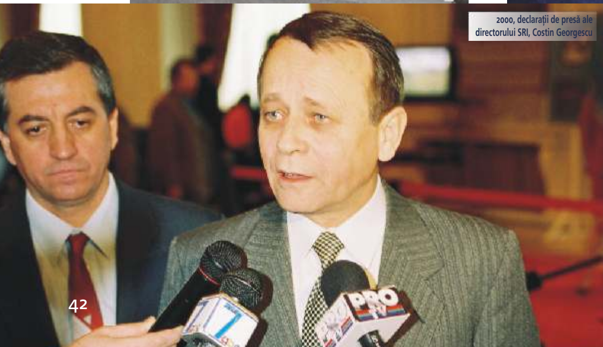
2000, declarații de presă ale directorului SRI, Costin Georgescu