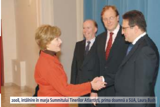
2008, întâlnire în marja Summitului Tinerilor Atlantici, prima doamnă a SUA, Laura Bush