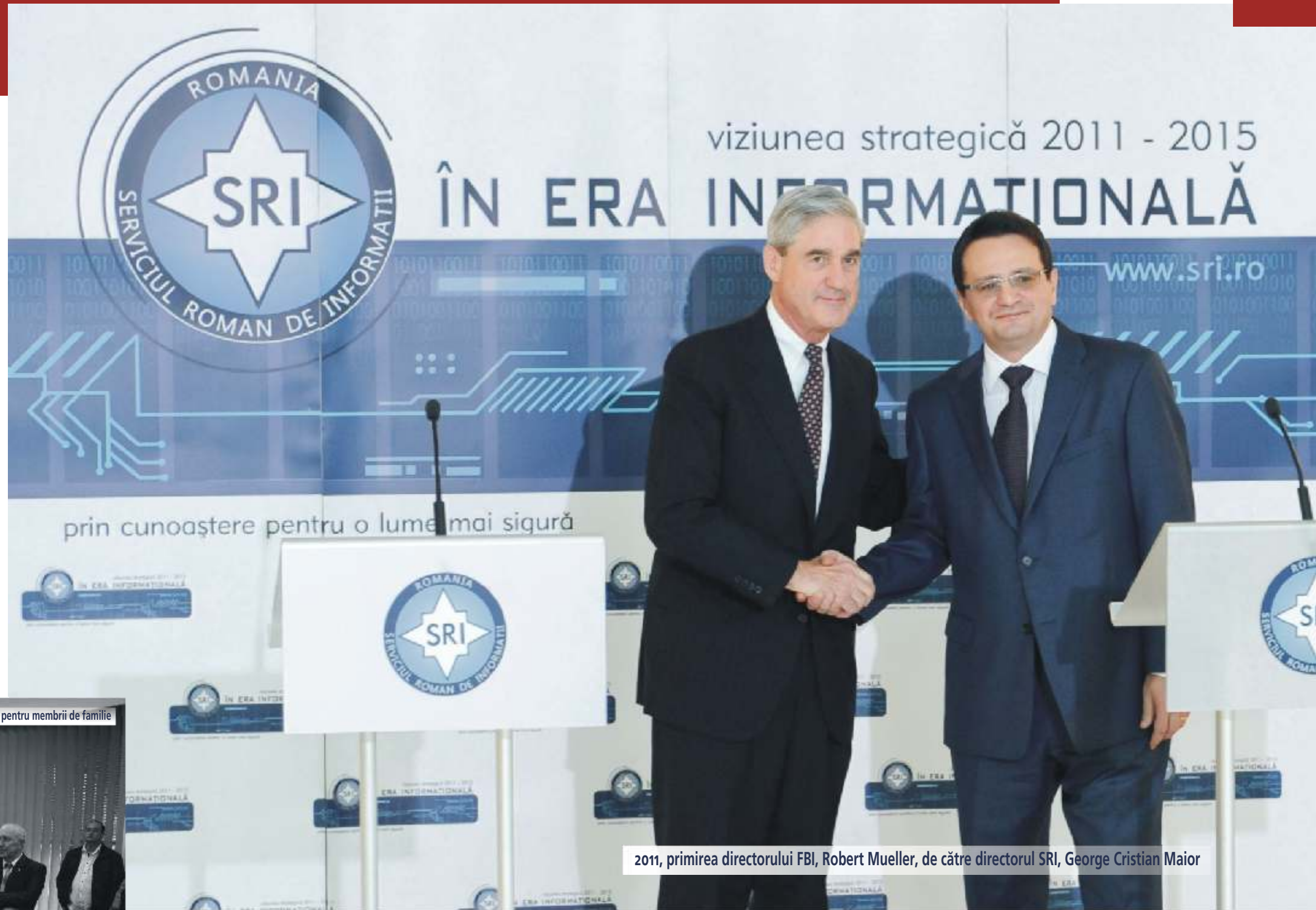
2011, primirea directorului FBI, Robert Mueller, de către directorul SRI, George Cristian Maior

ROMANIA SERVICIUL ROMAN DE INFORMATII SRI viziunea strategică 2011 - 2015 ÎN ERA INFORMAȚIONALĂ www.sri.ro prin cunoaștere pentru o lume mai sigură