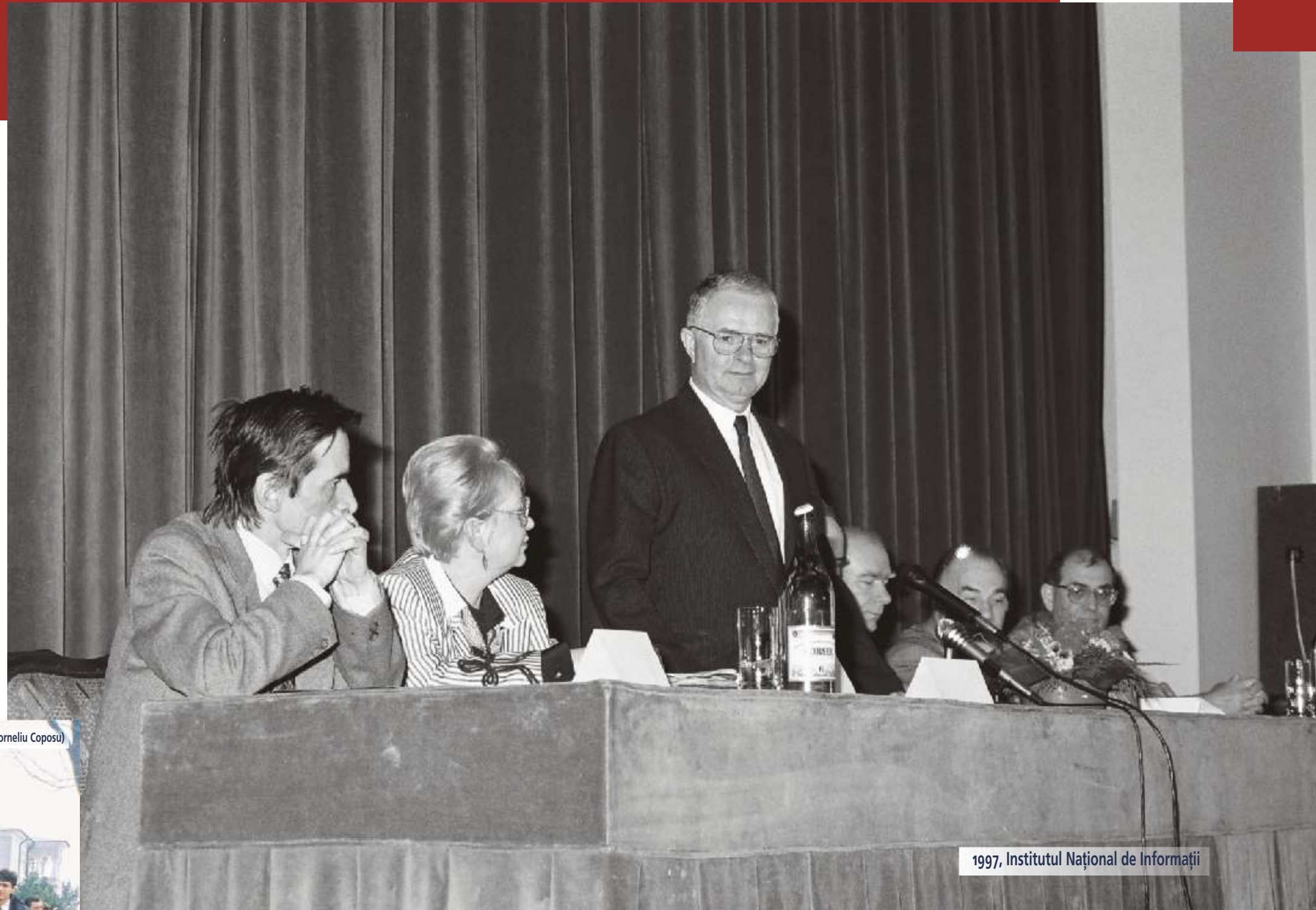
1997, Institutul Național de Informații