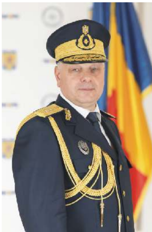
General-maior Ion GROSU Adjunct al directorului SRI

În anul 1990, Serviciul Român de Informații pleca pe un drum complicat, având provocări majore în fața atât din perspectivă internă, traduse prin necesitatea de reformă și adaptare la cerințele unui serviciu de informații modern, cât și de natură externă, care aveau să presupună o luptă lungă și dificilă pentru a câștiga încrederea societății românești în activitatea Serviciului și a ofițerilor săi.