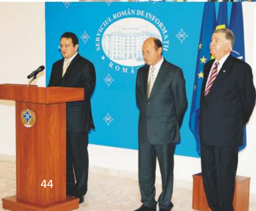
2006, conferința de presă organizată cu ocazia investiției lui George Cristian Maior ca director al SRI