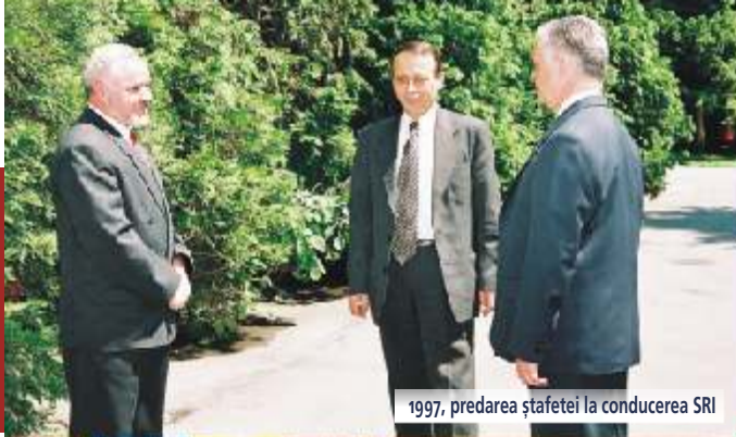
1997, predarea ștafetei la conducerea SRI