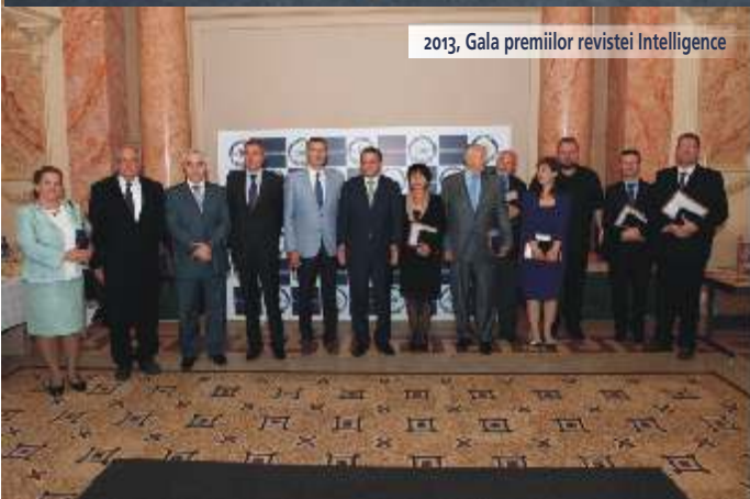
2013, Gala premiilor revistei Intelligence