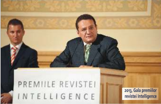
2013, Gala premiilor revistei Intelligence