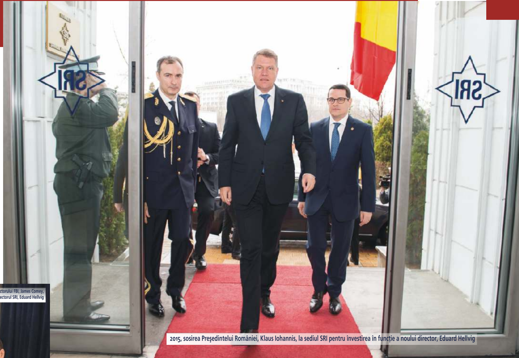
2015, sosirea Președintelui României, Klaus Iohannis, la sediul SRI pentru investirea în funcție a noului director, Eduard Hellvig