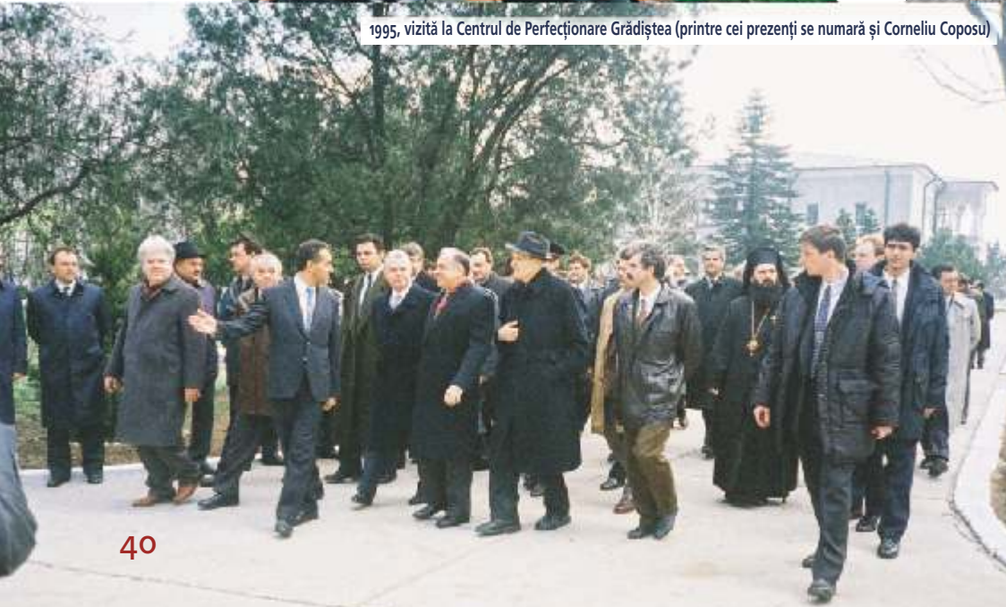
1995, vizită la Centrul de Perfecționare Grădiștea (printre cei prezenți se numără și Corneliu Coposu)