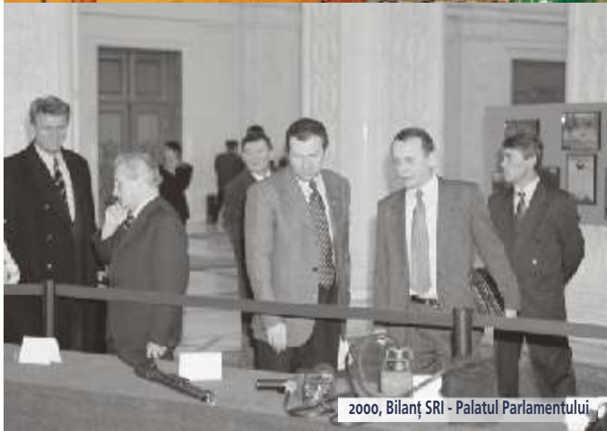
2000, Bilanș SRI - Palatul Parlamentului