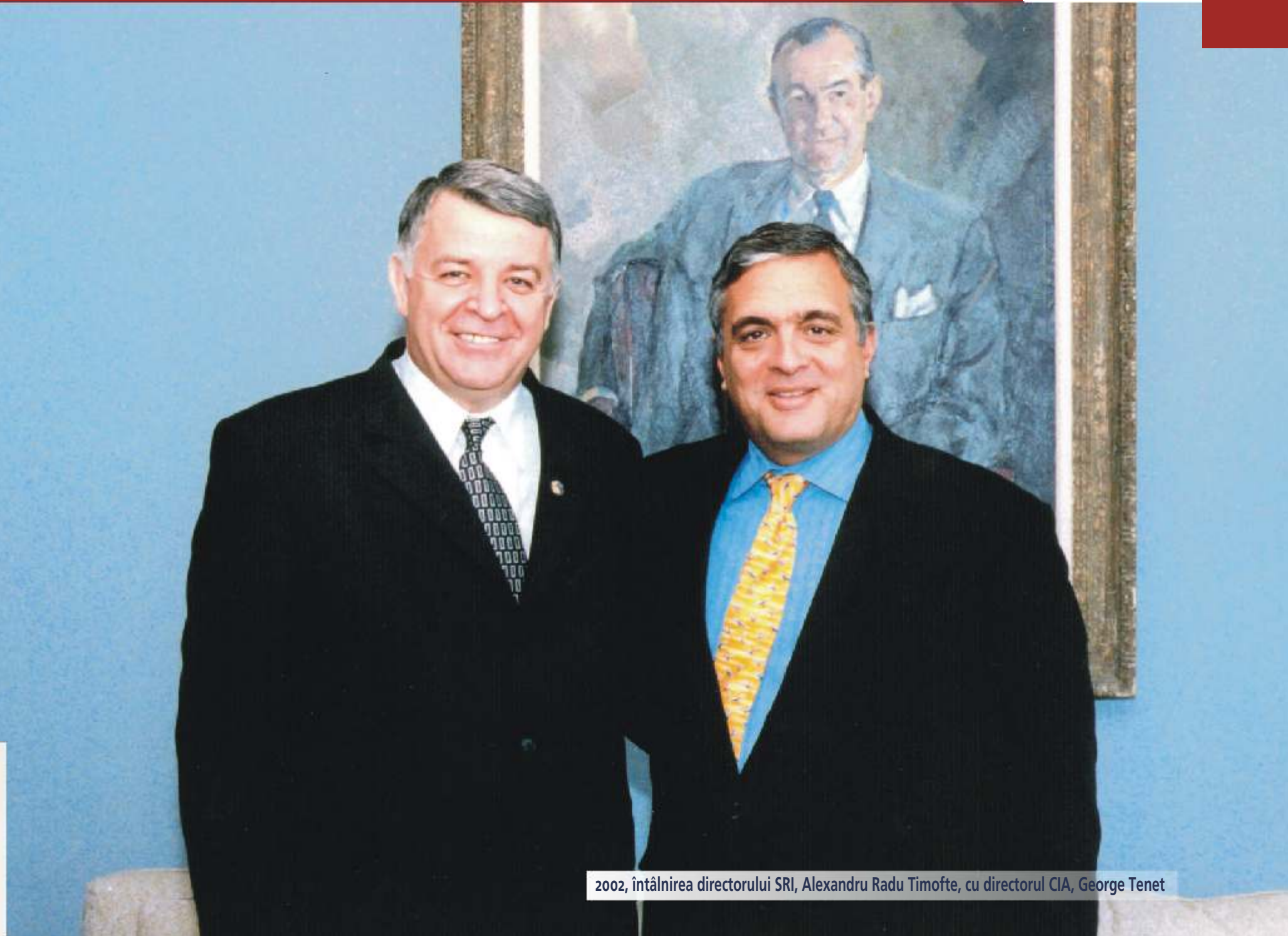
2002, întâlnirea directorului SRI, Alexandru Radu Timofte, cu directorul CIA, George Tenet