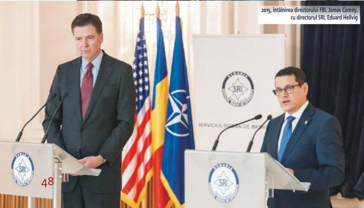
2015, întâlnirea directorului FBI, James Comey, cu directorul SRI, Eduard Hellvig