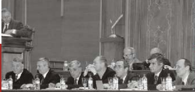
2001, prezentarea raportului de activitate al SRI în Parlamentul României