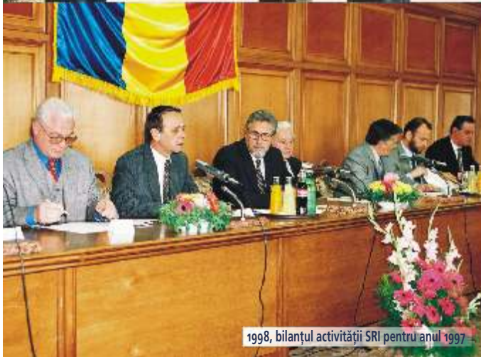
1998, bilanțul activității SRI pentru anul 1997