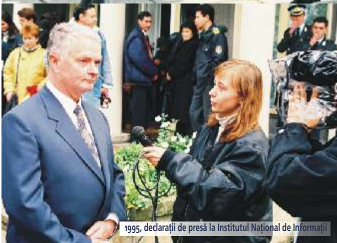
1995, declarații de presă la Institutul Național de Informații