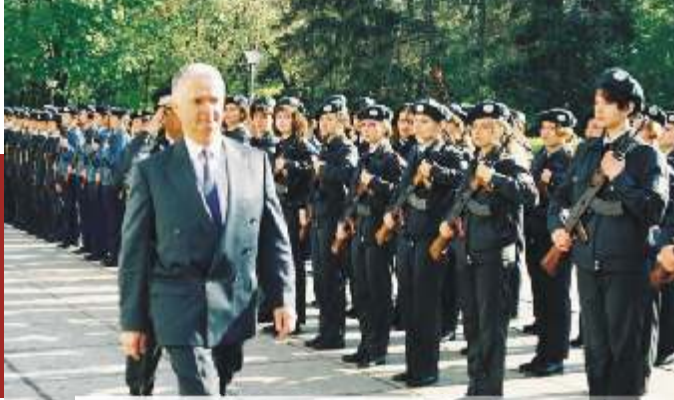
1994, depunerea jurământului de către studenții Institutului Superior de Informații