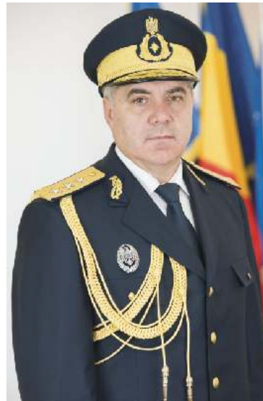
General-locotenent Dumitru COCORU Adjunct al directorului SRI

În acord cu dinamica politicilor publice europene, dar și în contextul unor restricții și limitări generate de efectele crizei financiare și de evoluția macroeconomică care au încetinit procesul de implementare a viziunii modernizării Serviciului,