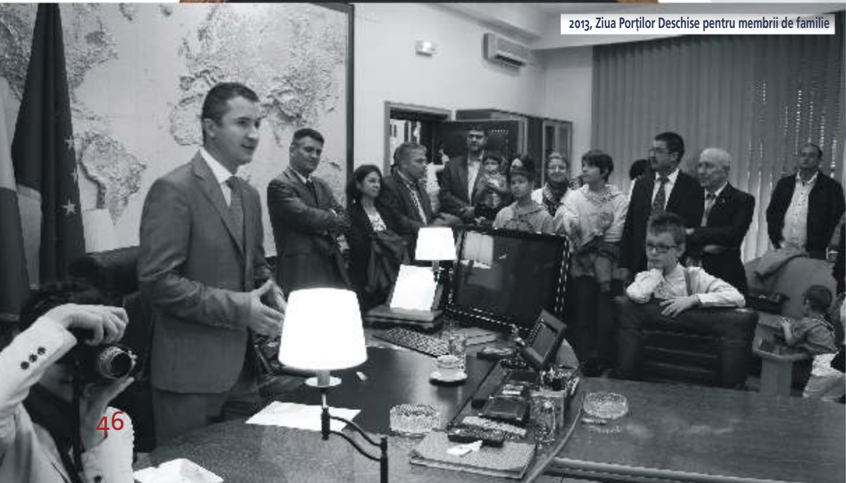
2013, Ziua Porților Deschise pentru membrii de familie