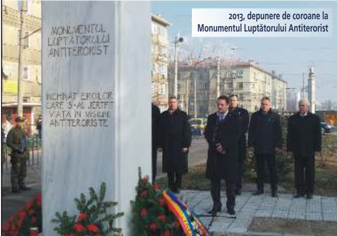
2013, depunere de coroane la Monumentul Luptătorului Antiterorist